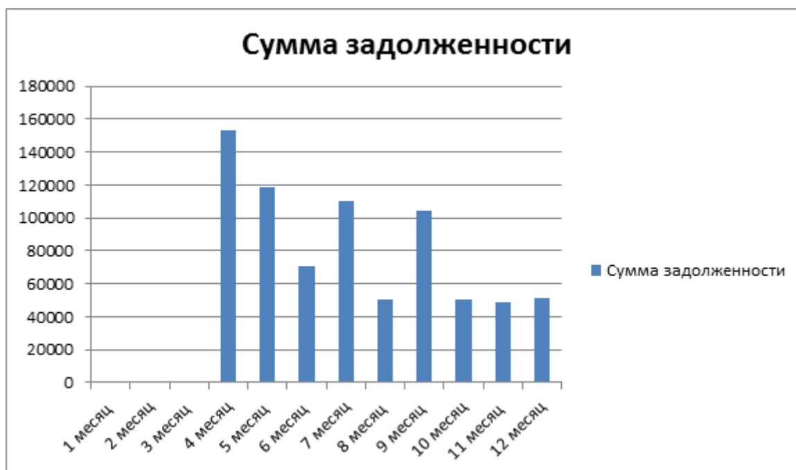
Рисунок 2 - Гистограмма сумм задолженности по услугам ЖК в ООО «Жилищно-Эксплуатационный Комбинат»

Как было указано ранее, одной из причин возникновения задолженности граждан в сфере ЖК является нахождения собственника квартиры в другом городе или стране. В данном случае, из-за юридической неграмотности собственник квартиры считает, что если он не проживает в своем жилище, он и не обязан за него платить и предупреждать управляющую компанию об его отсутствии и сроках его нахождения в другом регионе.