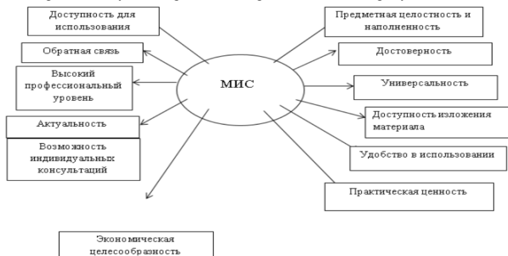
Рисунок 1- Методическая информационная система

Согласно современным условиям работы бухгалтера информационные технологии должны содержать следующие требования, представленные на рисунке 1.